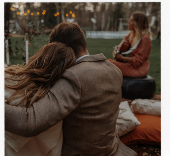
jullie eigen verhaal